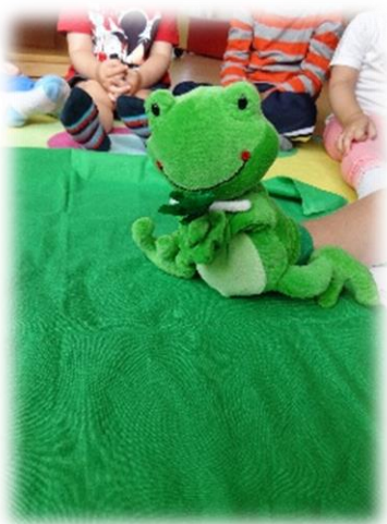
Geschichtensäckchen: „Der Frosch und die Fliege“